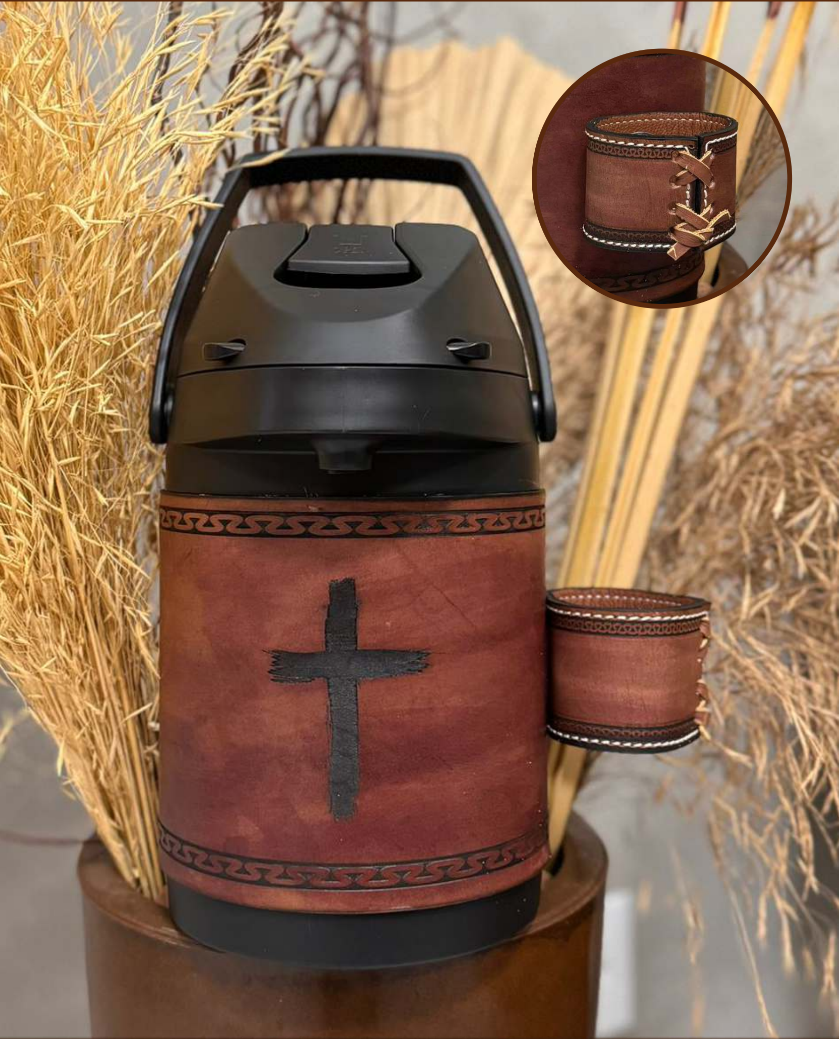
Cruz da Fé | Couro Marrom Escuro