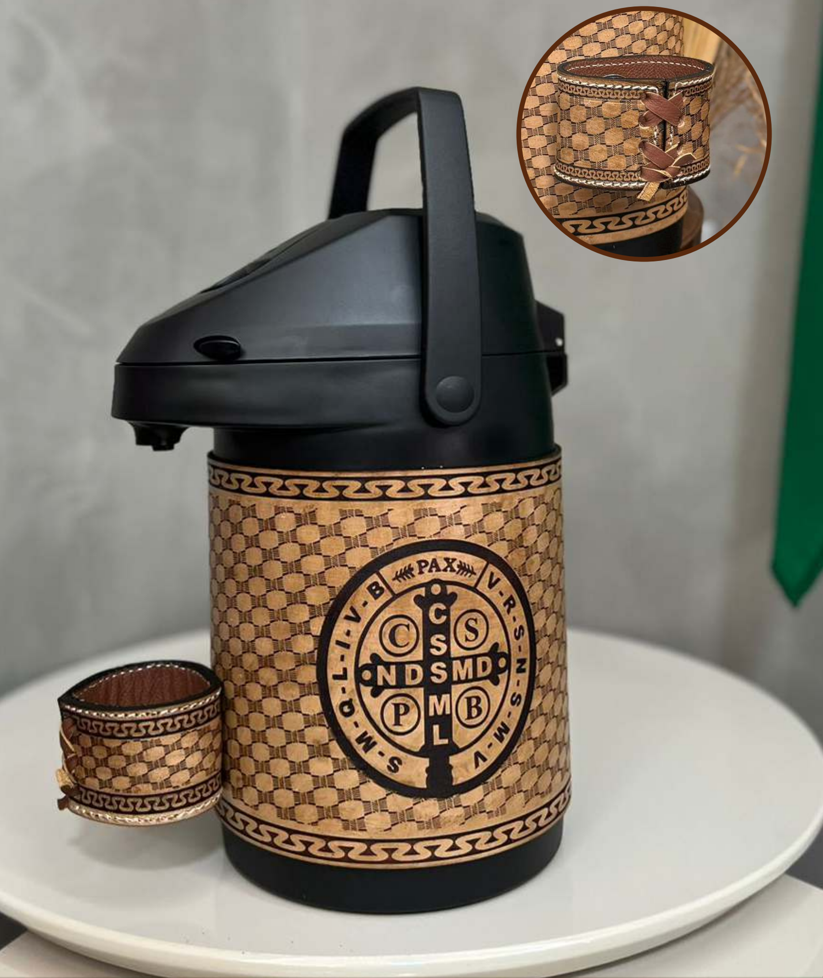
Símbolo de São Bento | Couro Asterado