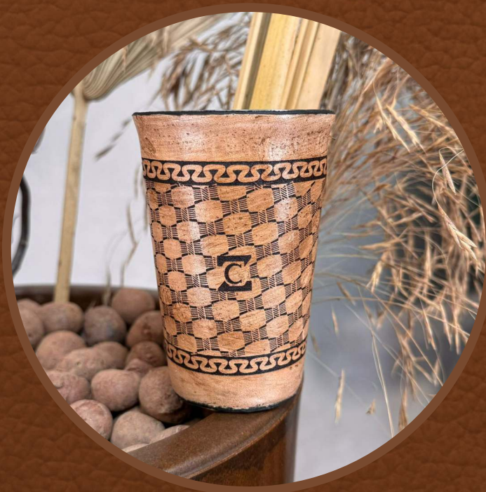
Couro Creme Asterado