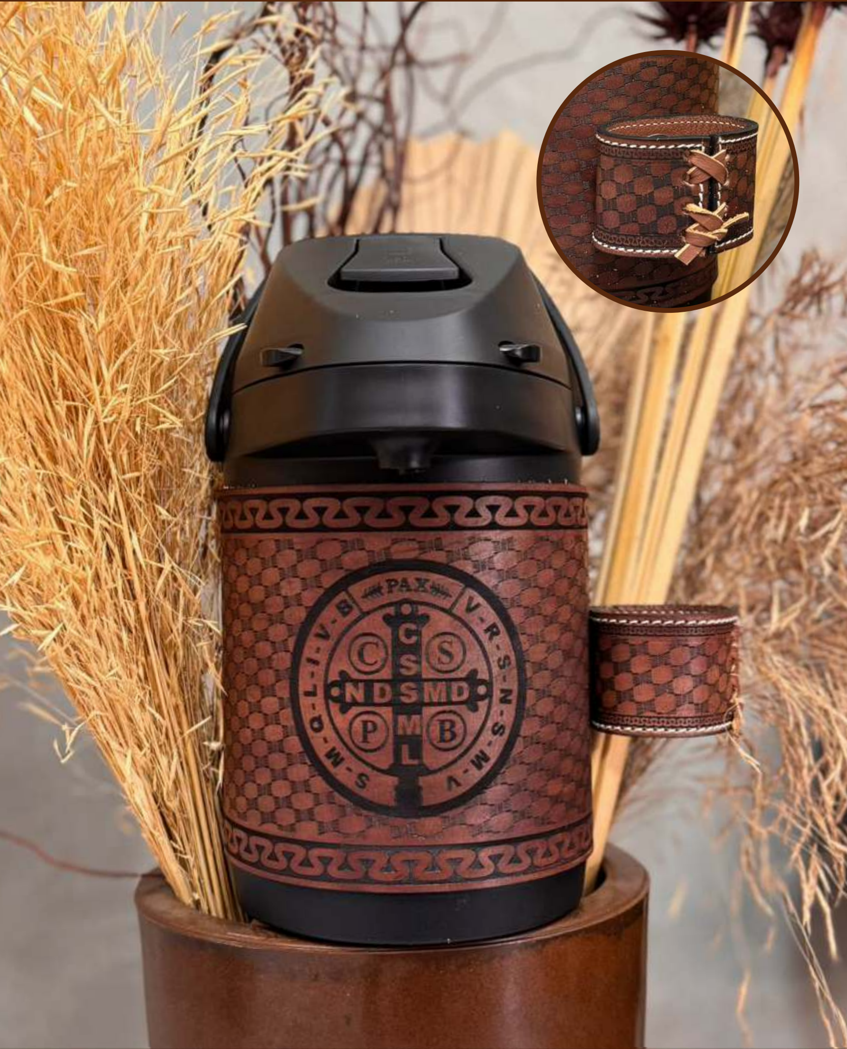
Símbolo de São Bento | Couro Marrom Escuro Asterado