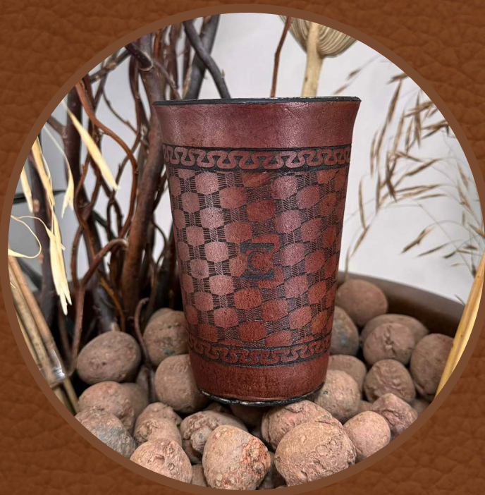
Marrom Escuro Asterado