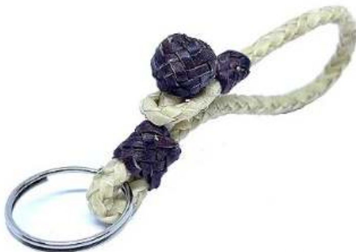
Chaveiro Couro de Carneiro Artesanal Branco