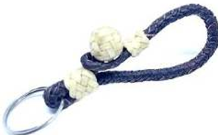
Chaveiro Couro de Carneiro Artesanal Marrom Escuro