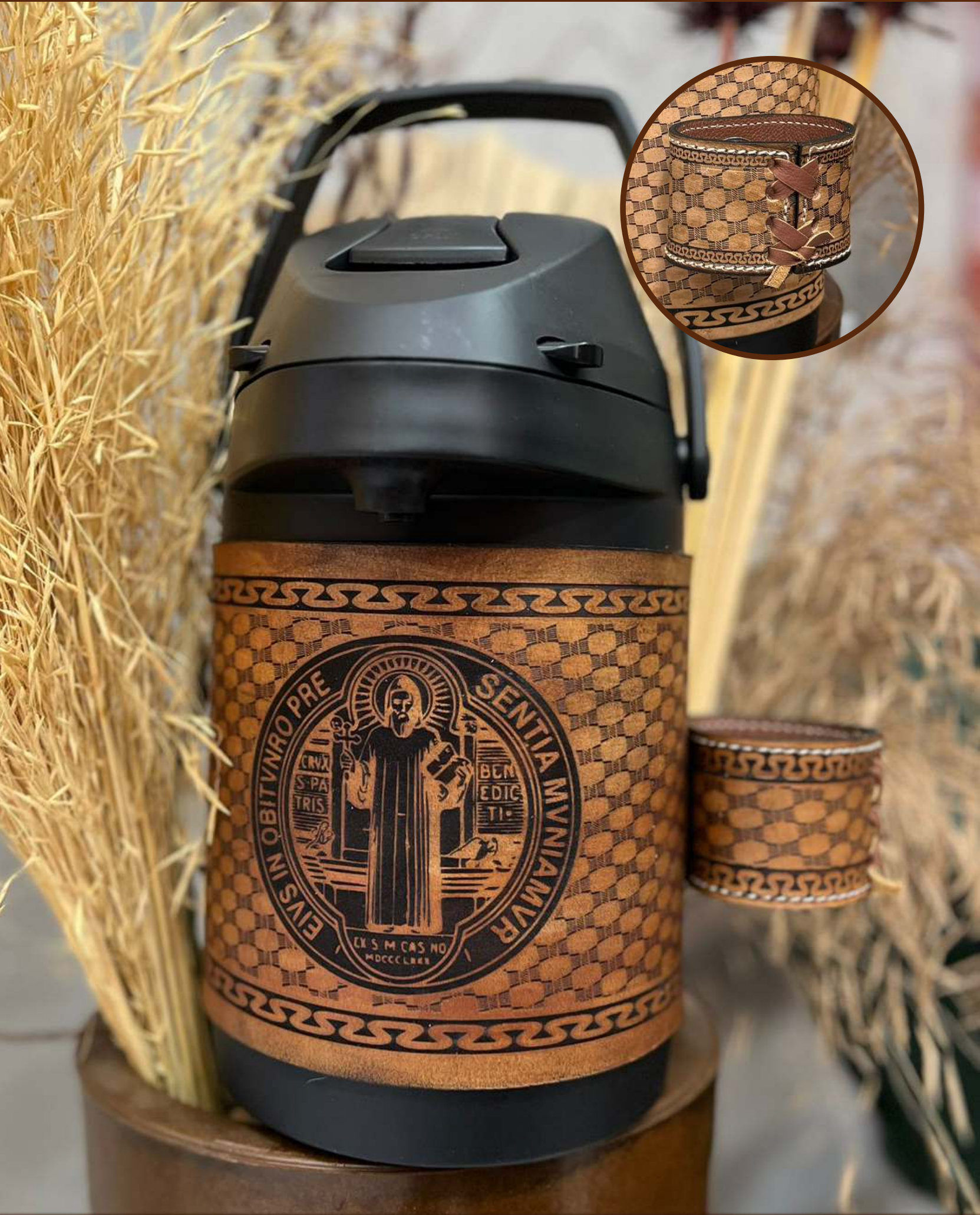
São Bento | Couro Havana Asterado