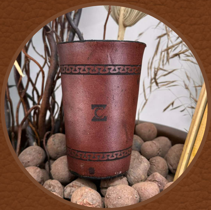
Couro Marrom Escuro