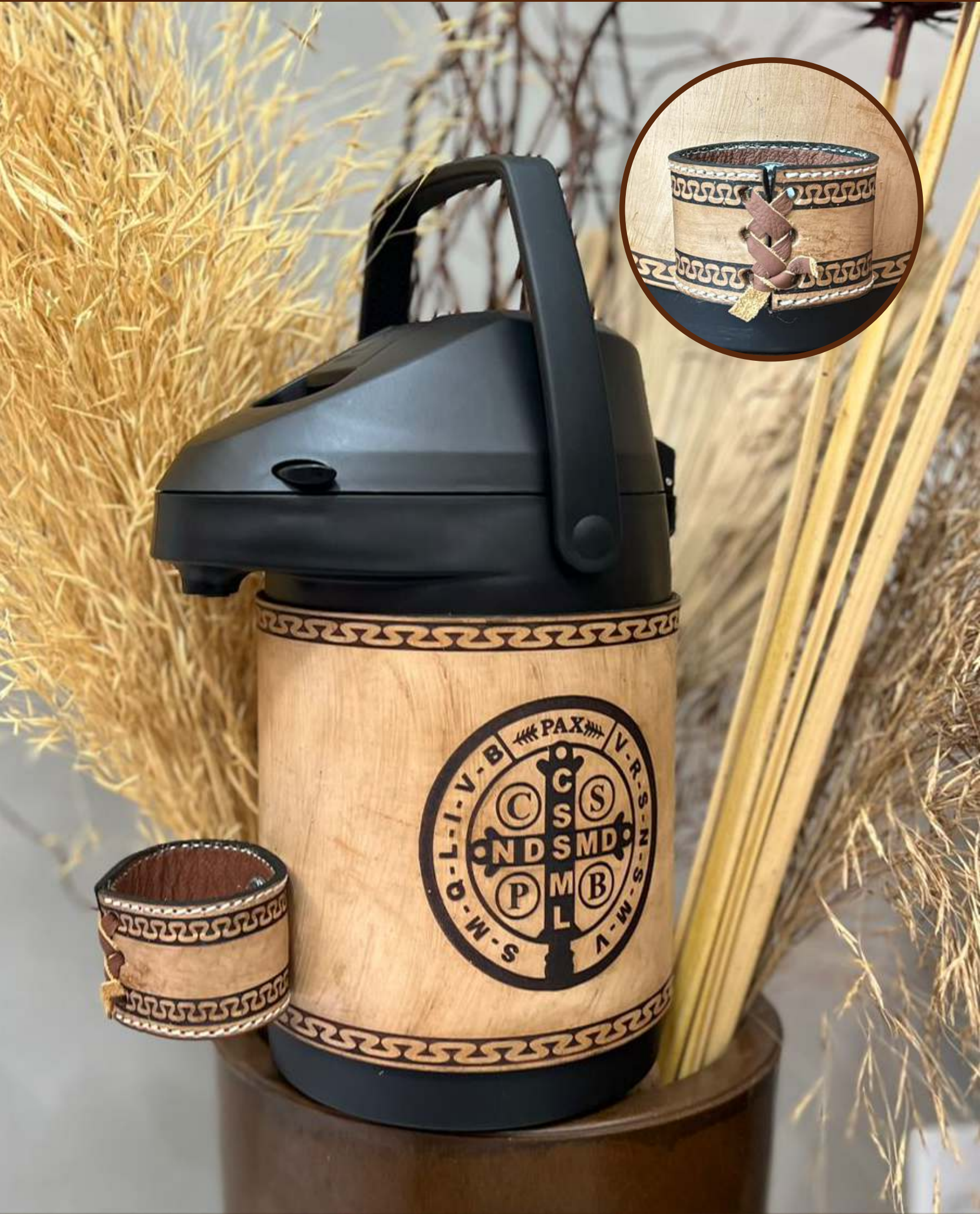
Símbolo de São Bento | Couro Creme