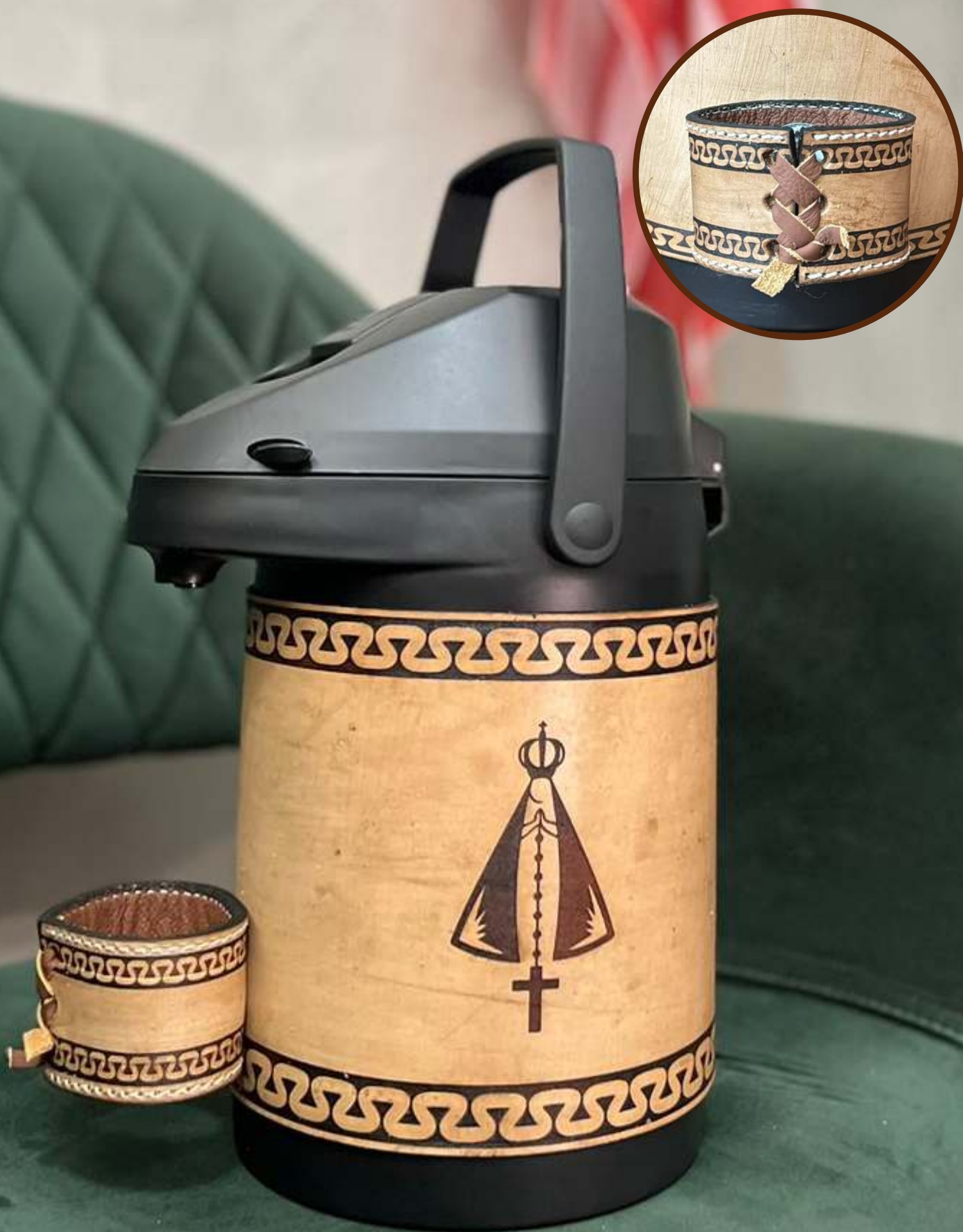
Nossa Senhora | Couro Creme