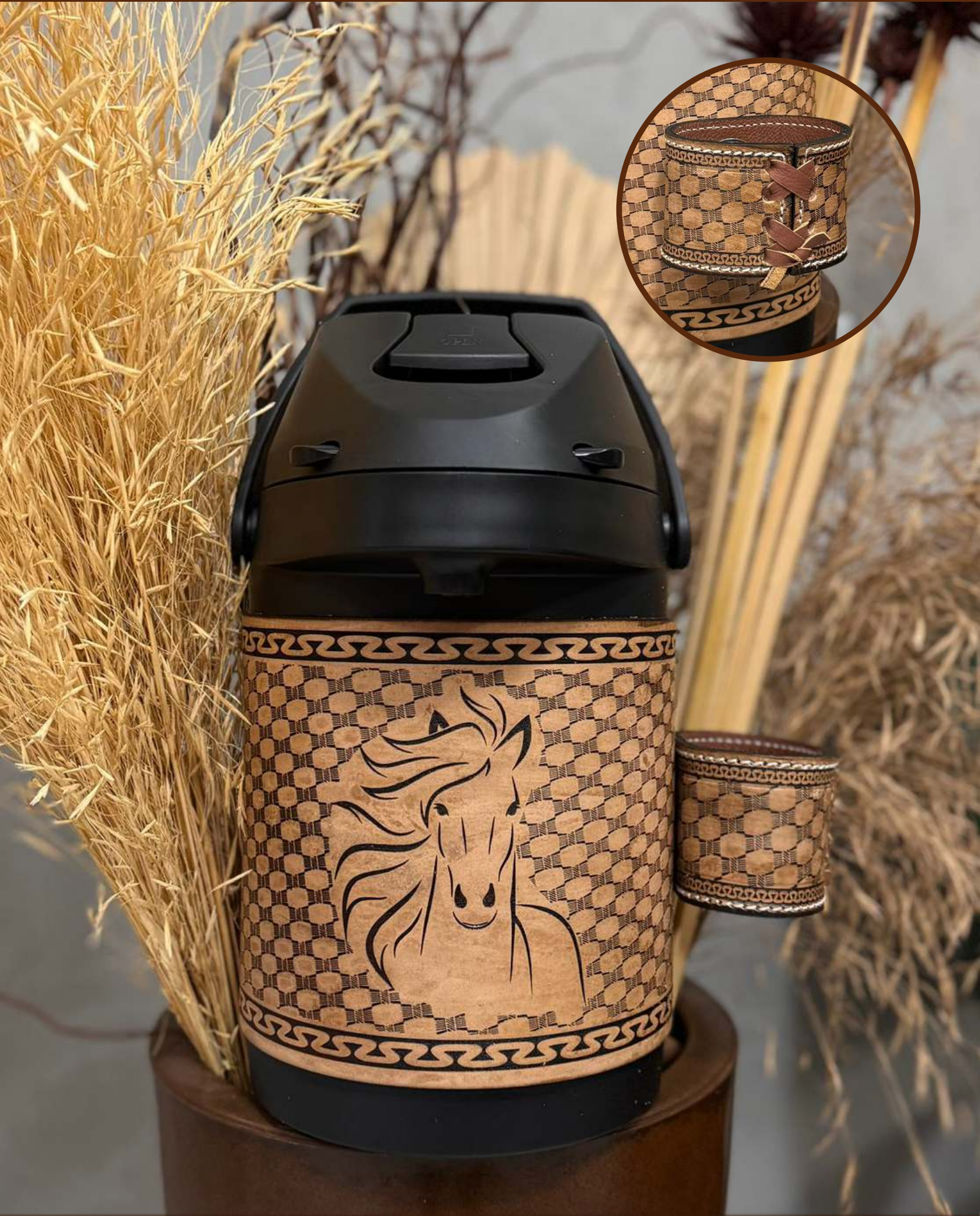
Cavalo | Couro Asterado