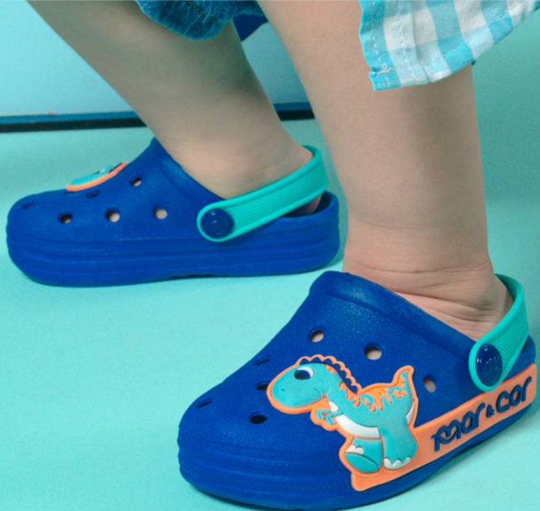
● Babuche Aquarela Kids 104-004-021 25 ao 34