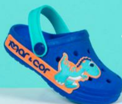
● Babuche Aquarela Baby 102-004-015 17 ao 24 19 ao 26