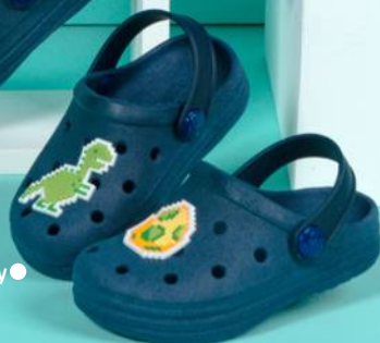
Babuche Aquarela Baby ● 102-005-031 17 ao 24 19 ao 26